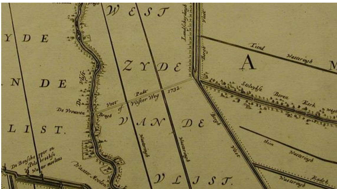
Het Kraamvrouwenpad ("Voet Pad of Vlister Weg 1732")

Het pad liep van de Vrouwenbrug naar de Bergvliet, waar je kon worden overgezet door een veerman. Doel van het pad zou zijn geweest om de arts of vroedvrouw uit Stolwijk in staat te stellen snel naar kramende vrouwen in Vlist te gaan. Misschien was het ook een kerkepad voor inwoners van Vlist om naar de kerk in Stolwijk te gaan.