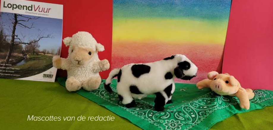
Mascottes van de redactie