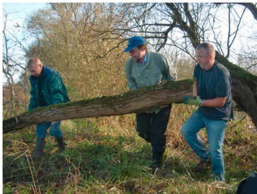
Met vereende krachten

kade, die jarenlang dichtgegroeid was te 'schonen'? Het parkschap vond het een goed idee.