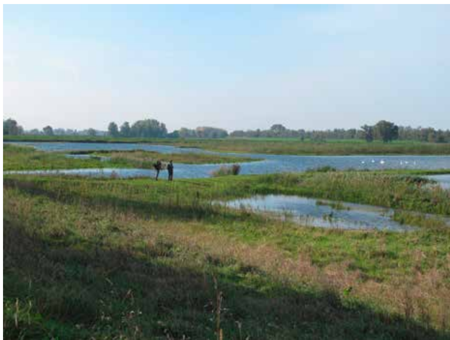
Het gebied van de Jantjesplaat. In het bos aan de horizon loopt een mooi griendpad.

In de Brabantse Biesbosch is een mooi nieuw wandelgebied ontstaan. In het kader van Ruimte voor de Rivier wordt een gigantisch stuk in cultuur gebrachte Biesbosch, de Noordwaard, op de schop genomen. Bij hoge waterstanden wordt dat een overloopgebied. Doelstelling is een waterstanddaling bij Gorinchem van 30 cm. Het hele project moet eind 2015 klaar zijn. Maar een deel is al klaar en dat is nu een prachtig wandelgebied geworden. In 3 à 4 uur kan je het hele gebied doorkruisen.