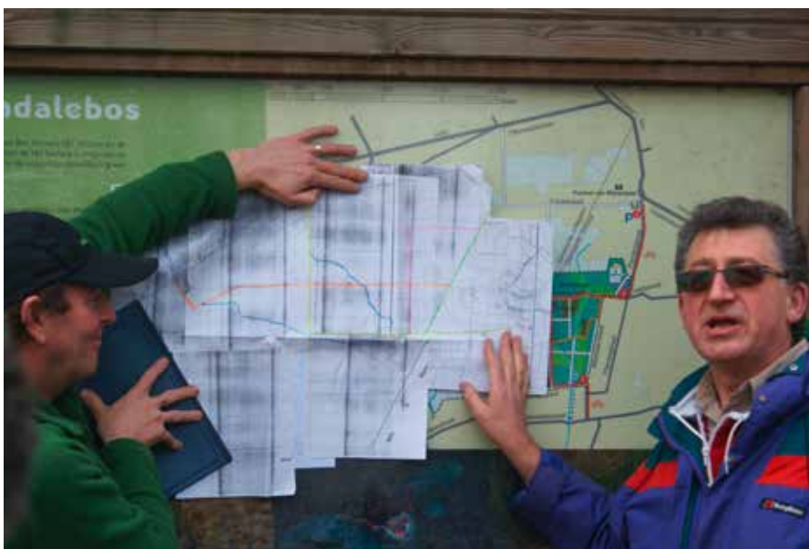
Uitleg over verdwenen en nog aanwezige buurtwegen op landgoed Wijnendaal bij Torhout.

rende folder leer je ook meer over de natuur en de cultuur. Weet je bijvoorbeeld waarvoor het jaagpad langs de Oude Rijn vroeger diende? Of wil je meer weten over cope-ontginningen? Dan lees je hierover en over andere bijzondere natuur en cultuurhistorie langs de route, meer in de folder die bij dit Klompenpad hoort. Ook is er een app ontwikkeld voor de beide routes. Met de smartphone in de hand ontdek je bijzondere plekken en hoor je interessante achtergrondverhalen van het gebied. Een kaart is overbodig, want de app wijst de weg. Meer informatie over het Houtdijkenpad en Graveslootpad en andere Klompenpaden staat op www.klompenpaden.nl .