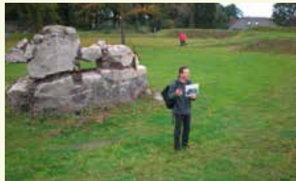
Uitleg bij de Grebbeelinie

tweetal werken van de Grebbeelinie met een gids van stichting 'De Grebbeelinie' bezocht, het Werk aan de Daatselaar en het grootste fort van de Grebbeelinie: Fort aan de Buurtsteeg, aangelegd in 1786. Deze laatste is een aarden vesting, omgeven door natte grachten. In Renswoude voert de wandeling langs kasteel Renswoude (gebouwd in 1654) met een fraaie baroktuin en de Koepelkerk met een karakteristieke achtkantige koepel. Tot slot is Werk aan de Engelaar bezocht.