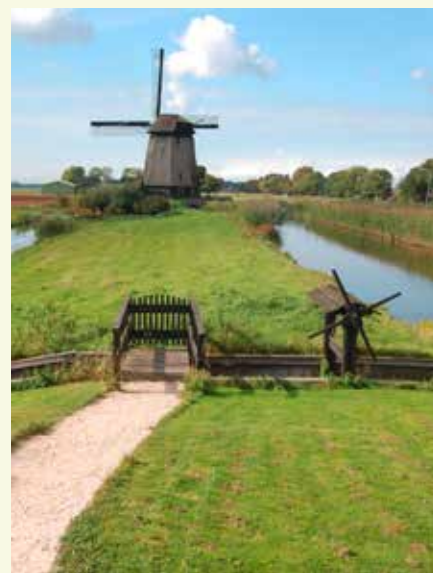
De Molengang bij Schermerhorn