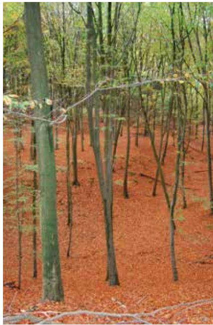
De beuken verliezen hun blad 4

uitgang Mookerheide nemen. Bordje wandelroute Twee Schansenroute volgen. Voor het hek linksaf en bij bordje van Natuurmonumenten rechtsaf trap omhoog nemen. Boven gekomen, linksaf (je verlaat de Twee Schansenroute, die rechtsaf gaat; later kom je van die kant weer terug). Op asfaltweg linksaf door het hek van het jachtslot De Mookerheide. Op asfaltweg even linksaf en direct na bord Molenhoek rechtsaf onverhard pad in. Na ongeveer 350 meter rechtsaf het tweede pad in, door een klaphek, dat in een slinger langs de bosrand gaat. Dit volgen, ongeveer 600 meter lang. Het pad stijgt. Het pad komt uit op een T splitsing, linksaf. Verder langs de bosrand