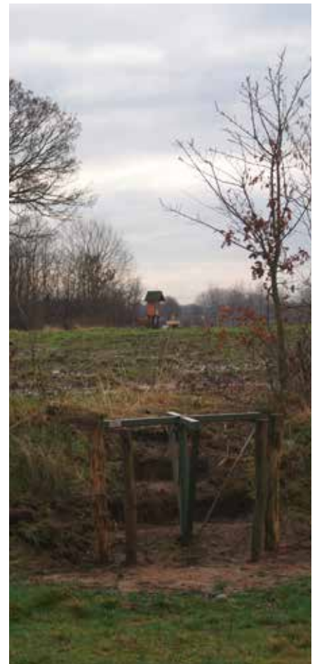
Doorgang naar het veldkapelletje

Toch nog eens gaan praten of de wandelaar vanuit Meersel-Dreef niet op een andere manier bij het veldkapelletje kan komen én het dal van de Mark kan beleven. Met een beetje geluk – realisering van een doorsteek van nog geen honderd meter op Belgisch grondgebied – met een bruggetje over de Strijbeeksebeek en met medewerking van Natuurmonumenten – er heeft ooit een natuurpad gelopen, omdat het nogal in een uithoek lag werd het nauwelijks gebruikt – zou het moeten lukken. Eigenlijk net zo mooi, zo niet mooier, en je hoeft niet over het drukke fietspad langs de Mark. Een eindje stroomopwaarts op de Strijbeeksbeek hebben Staatsbosbeheer en zijn Vlaamse tegenhanger het Agentschap Natuur en Bos met twee bruggetjes natuurgebieden aan beide zijden van de grens met elkaar verbonden. Een grensbeek oversteken hoeft dus geen onoplosbaar probleem te zijn. Gelukkig dat het pontje niet de vorige Lopend Vuur heeft gehaald, want dan had er nu moeten worden gerectificeerd. Het traject zat wel in de jubileumwandeling, maar je begrijpt, daar zijn we toen maar niet meer langsgaan.