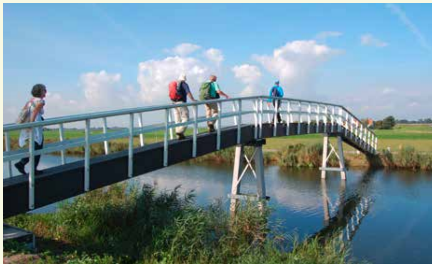
Brug over de ringvaart

aan de overkant van het water de N 243 over. Hier kan je de museummolen bezoeken.