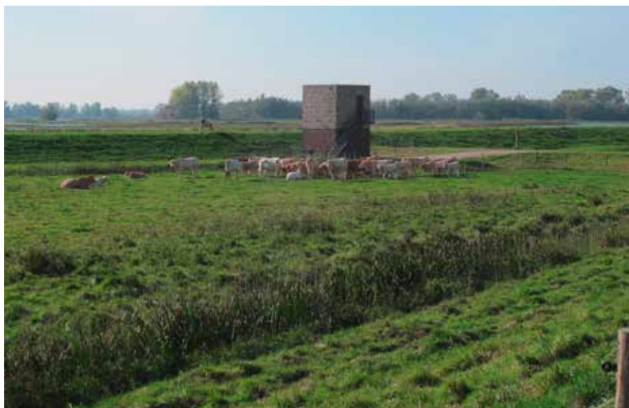
Het gemaalhuisje dat toegang geeft tot de Hoge Hof. De bossen op de achtergrond zijn van de Deeneplaat, nu zonder eigen boot nog niet toegankelijk.

Je kunt er op twee manieren komen, vanuit Dordrecht en vanuit Werkendam. Vanuit Dordrecht rijd je oostwaarts naar De Kop van 't Land, alwaar een veerboot je overzet naar de Brabantse kant; je kunt ook je auto aan de Dordtse kant laten staan en lopen of fietsen naar ons startpunt (1,5 km). Aan land komend aan de brabantse kant ga je bij de T-kruising rechtsaf en bij de volgende splitsing weer rechtsaf, over de Spieringsluis, langs 2 horecagelegenheden naar een grote parkeerplaats. Vanaf Werkendam volg je de borden naar Dordrecht, na ca 9 km ga je niet