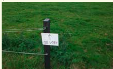
In Delfland alleen op de wandeldag toegankelijk voor TeVoet

vestingstad, kwamen langs een synagoge en gingen naar het reeds 10 jaar bestaande Bos op Houwingaham, aangelegd in het kader van de Ecologische Hoofd Structuur (EHS). Een bijzonder kunstwerk van 7 plateaus is aangelegd in het Bos op Houwingaham. De onder het bos liggende resten van het dorp Houwingaham (verdwenen in de Dollard) zijn zichtbaar in bruin, terwijl de paden, die nu door dit bos lopen getoond worden.