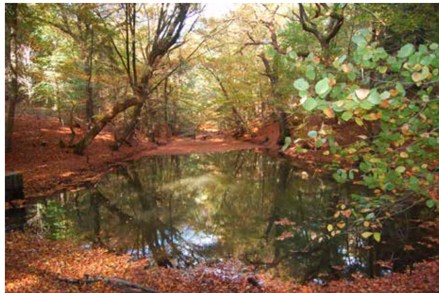
Rechtsaf een dammetje over

uitgang Mookerheide nemen. Bordje wandelroute Twee Schansenroute volgen. Voor het hek linksaf en bij bordje van Natuurmonumenten rechtsaf trap omhoog nemen. Boven gekomen, linksaf (je verlaat de Twee Schansenroute, die rechtsaf gaat; later kom je van die kant weer terug). Op asfaltweg linksaf door het hek van het jachtslot De Mookerheide. Op asfaltweg even linksaf en direct na bord Molenhoek rechtsaf onverhard pad in. Na ongeveer 350 meter rechtsaf het tweede pad in, door een klaphek, dat in een slinger langs de bosrand gaat. Dit volgen, ongeveer 600 meter lang. Het pad stijgt. Het pad komt uit op een T splitsing, linksaf. Verder langs de bosrand