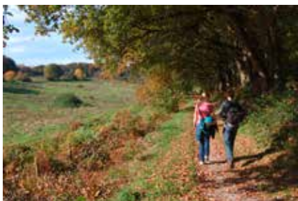
Langs de bosrand

linksaf over een pad dat in vele slingers de contouren van het reliëf volgt. Zijpaden naar links negeren. Doorlopen tot een T kruising. Hier rechtsaf, na een tiental meters heb je een weiland aan je rechterhand. Neem het eerste pad rechtsaf, aan het einde van het weiland (pad met wit/rode markering). Steeds rechtdoor, je loopt als het ware op wat ze in de bergen een zadel noemen. Als het pad daalt na een bank, na 75 meter schuin rechtsaf, steil naar bene-