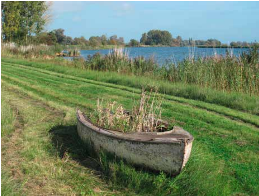
Op de kade van de Hoge Hof; uitzicht naar het noorden op het Gat van den Kleinen Hil

rechtsaf naar de pont maar rechtdoor, vervolgens bij een splitsing rechtsaf, over de Spieringsluis, langs 2 horecagelegenheden naar een grote parkeerplaats. Openbaar Vervoer is moeilijk; er rijden een paar bussen per dag tussen Werkendam en Dordrecht, maar niet in het weekend; kijk op internet 9292.nl. De twee horecagelegenheden bij de Spieringsluis zijn in de zomertijd het hele jaar open, in de wintertijd alleen in de weekenden. Een endje terug, 2,5 km van de parkeerplaats ligt het Biesboschmuseum, met koffieautomaat. Het wordt verbouwd en is tot juni 2015 gesloten.