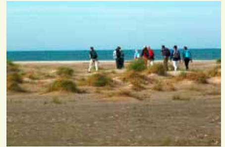
Op het strand bij de Kwade Hoek

Op 18 oktober liepen 30 (een record) deelnemers met gidsen van IVN en Natuurmonumenten de wandeling die