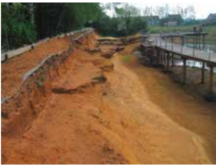
Meester van der Heyden groeve

Dit voorjaar is het laatste stuk van wandelnetwerk Zeeuws-Vlaanderen (WNW) "Langs Linies en Kreken" officieel geopend. Dat gebeurde bij "De Vogel" te Hengstdijk. De opening vond plaats rondom een oude trambrug midden tussen de akkers. Twee boerenlandpaden brengen de wandelaars vanaf beide zijden daar naar toe. De (oude) wethouders van de gemeenten Terneuzen en Hulst hadden de eer een laatste tak weg te zagen onder bescherming van medewerkers van de Stichting Landschapsbeheer Zeeland (SLZ). SLZ is de coördinator van het werk van de vele vrijwilligers, die dit WNW in opdracht van de twee gemeenten en de provincie Zeeland hebben aangelegd.