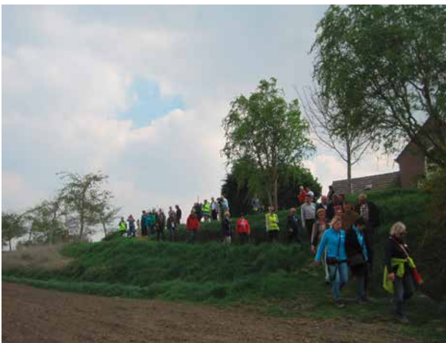
Opening Langs Linies en Kreken boerenlandpad

De splitsing van de variant met de hoofdroute vindt plaats bij de baileybrug voor Boekhoute, kaart 8 van de gids, bij kpp 41. Deze variant passeert niet minder dan 7 keer de landsgrens – niet overal is een grenspaal te zien. Kreken, forten en linies komen we volop tegen, zie hier boven. We maken kennis met de nog kleine overgebleven verdedigingswerken van Sas van Gent en met de bijna volledige omwalling van Hulst.