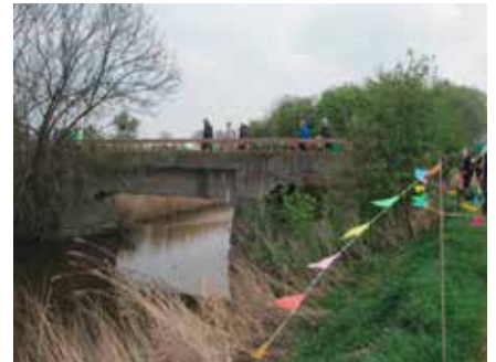
Opening Langs Linies en Kreken oude tram brug

De voorlopige kaart van "Langs Linies en Kreken" (het zuidelijke deel) was gratis te downloaden. Nu de kaart het gehele gebied oost Zeeuws-Vlaanderen omvat (t/m de Braakman) is deze alleen tegen betaling van 5,- te verkrijgen o.a. via www.vvzeeland.nl dan Zien & Doen – wandelen – wandelnetwerk.