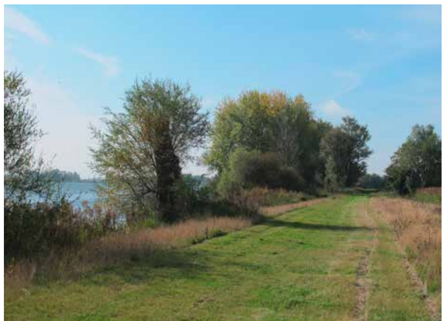
Op de kade van de Hoge Hof; uitzicht naar het zuiden op het Noordergat van de Visschen

Eind 2015 moet het hele gebied NO van het hier beschreven wandelgebied, de Noordwaard, klaar zijn. Dan zal het nog een tijdje duren voordat alles weer met gras begroeid is, maar het is duidelijk dat daar een heel interessant natuurgebied zal ontstaan. Vereniging TeVoet is al geruime tijd met Rijkswaterstaat, waterschap, gemeente, bewoners en Parkschap in gesprek om een aantal mooie onverharde wandelroutes door dat gebied te realiseren. Je hoort nog van ons.