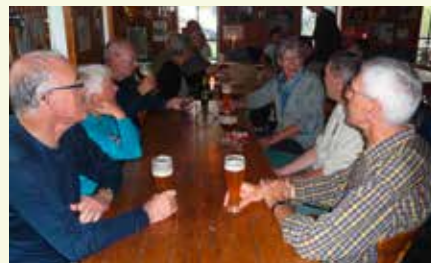
Een lekker biertje in brouwerij 't Kuipertje