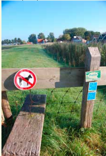
De graskade voor de aanlooproute naar de bushalte

We gaan deze brug niet over. Volg de Mijzerdijk. Deze maakt even voor Schermerhorn een bocht naar rechts langs het Zwet. Ga even verderop via een brug aan je linkerkant het dorp Schermerhorn in. Je komt bij de kerk uit. Ga rechtsaf het Westeinde op. Loop het Westeinde af tot het einde, ga voor het water linksaf de Zwartedijk op. Bij de provinciale weg (N 243) ga je rechtsaf het fietspad op. Kruis het water en steek