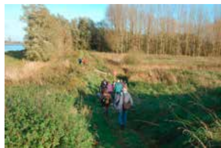
Polder Stededijk langs de Merwede

En zo voer op zaterdag 7 november een boot met ruim 30 vrijwilligers, merendeels TeVoet leden naar de polder Stededijk. Een medewerker van Staatsbosbeheer en van het Parkschap deelden ieder van ons een handzaag uit. Bij de eerste anderhalve kilometer was het al goed raak: De kade was totaal onbegaanbaar doordat talloze grote wilgen door ouderdom of stormen omgewaaid waren en over de kade lagen. En daar gingen we met onze handzaagjes aan de slag, eerst de grote takken eraf, maar al gauw bleek het nodig om hele stammen met doorsnedes van 20 à 30 cm door te zagen en dan met man