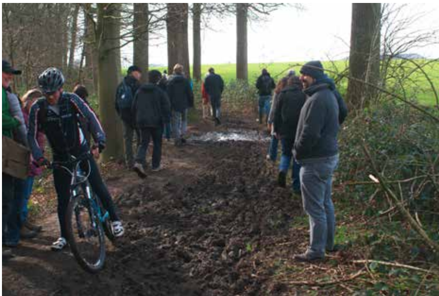
Wandelaars en mountainbikers gaan wel samen op een trage weg..