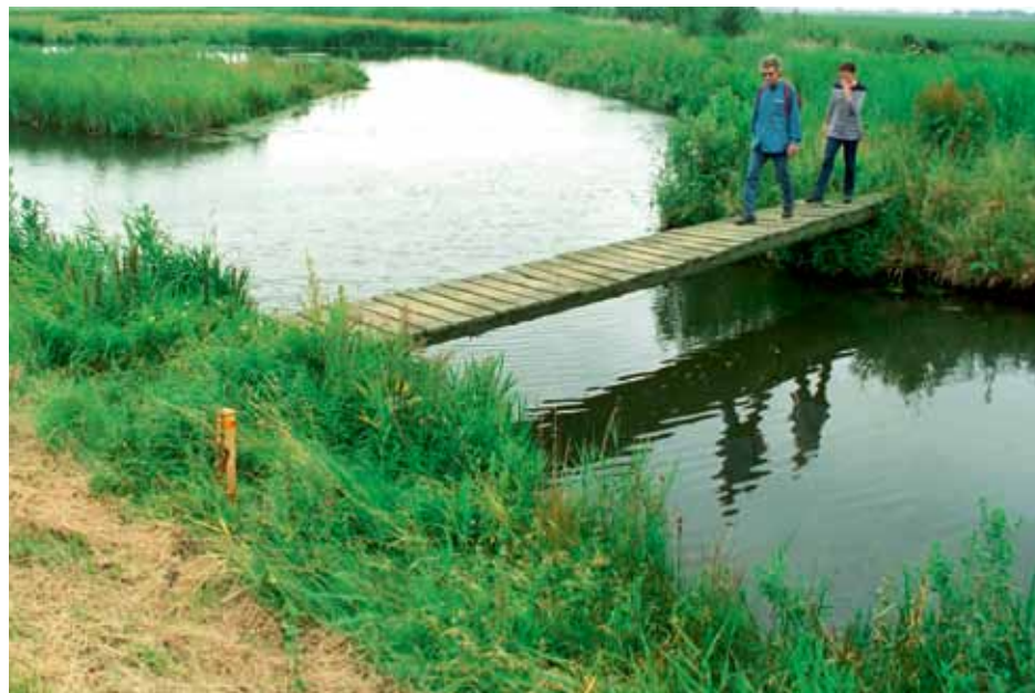
Dit gebied is druk bevolkt, maar tot dan toe met weinig mogelijkheden om dicht bij huis te recreëren

alle subsidies te stoppen. De beheercontracten met agrariërs voor het onderhoud van boerenlandpaden in het Land van Wijk en Wouden waren afgelopen, de regeling boerenlandpaden van het rijk stopte en ook de provincie twijfelde of ze door wilde gaan. 'Dat werden voor mij natuurlijk heel moeilijke gesprekken met de boeren: ik moest proberen om ze alle dertig weer mee te krijgen voor de komende jaren en tegelijkertijd kon ik ze geen zekerheid geven over de financiering. De voorzitter van de gezamenlijke agrarische natuurverenigingen dreigde vervolgens dat de paden dan ook onherroepelijk dicht zouden gaan per 1 januari 2012. Het was duidelijk als drukmiddel bedoeld om de provincie aan haar afspraken te laten houden. Misschien dat een paar boeren hun land wel open hadden gehouden, maar er waren er zeker ook, die om principiële rede-