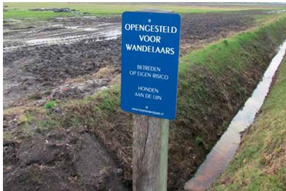
Bordje markeert het begin van het boerenlandpad

park, de plas waar 's zomers wordt gezwommen, een seismologisch station van het KNMI en het hotel voor even een kopje koffie. En dan verder langs het kanaal en de historische aanlegsteiger waar vroeger boten aanmeerden om de aardappels op te halen. Eigenlijk alle bezienswaardigheden van het dorp. 'En heel veel is door de mensen zelf gerealiseerd', vertelt Horsting. 'We hebben bijvoorbeeld zelf de brug in elkaar gezet, maar ook de aanlegsteiger en het pad langs het kanaal.'