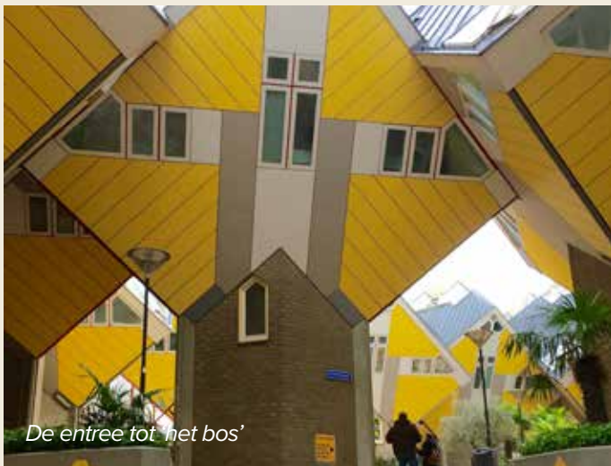
De entree tot 'het bos'

Bij het verlaten van het (metro)station Blaak zie je ze meteen: de gele kubuswoningen van architect Piet Blom. Ze ogen heel eigentijds, maar ze staan er al sinds 1984. En in Helmond hadden ze al 10 jaar eerder de primeur van deze bijzondere huizen. De opdracht was om de omgeving nieuw leven in te blazen. Blom koos ervoor een soort dorp te bouwen in de grote stad. De 38 paalwoningen zijn de bomen en het geheel vormt het bos: het Blaakse Bos. Een woonomgeving waarbij je het woord wonen vergeet, aldus de architect.