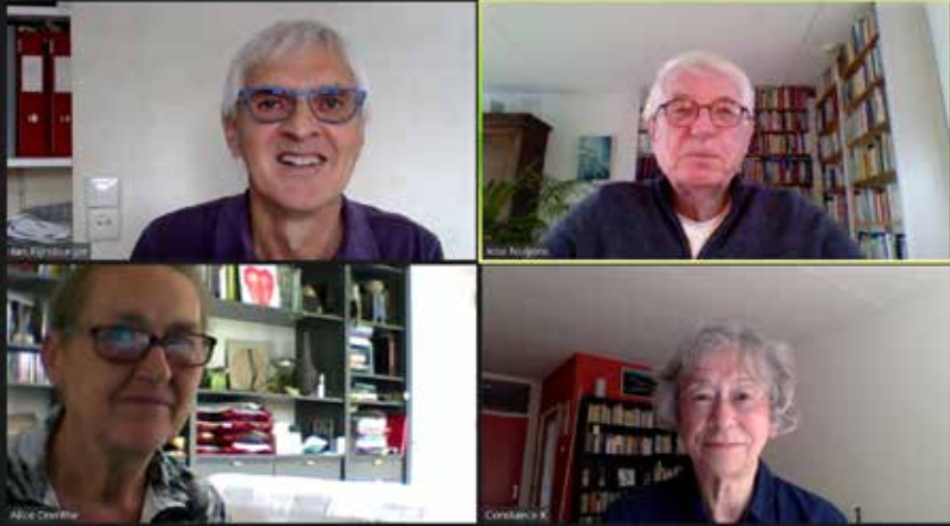
Redactieoverleg met Zoom