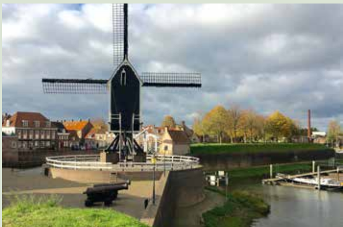
De haven van Heusden

het verleden meerdere rampen heeft overleefd (Spaanse belegering, de pest, grote stadsbrand, verwoesting stadhuis) is niet terug te zien. Na een decennia-lange restauratie is het nu een voorbeeldige vesting - hoewel het die status in 1821 verloor - met een beschermd stadsgezicht. De route maakt hier een rondgang over de wallen en de stadsmuur en langs de haven. Daar staan nog drie zg. standermolens. Die staan op een staak (=stander) en lijken daardoor te zweven.