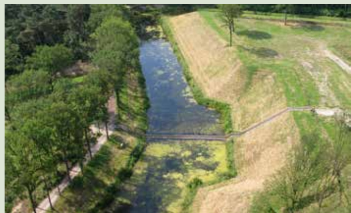
Alleen van boven zie je de 'brug'

Vanaf Bergen op Zoom loop je van knooppunt naar knooppunt, gebruikmakend van het Brabantse wandelroutenetwerk. Op de paaltjes staat het pad met een eigen symbool aangegeven. De stad heeft de bijzondere bijnaam 'de maagd', omdat zij van alle vestingsteden het minst vaak is ingenomen! Dat was ongetwijfeld mede te danken aan Fort De Roovere op zo'n 8 km afstand. Een aarden fort, een plek die nu meer aan een park doet denken dan aan een verdedigingswerk, tenminste als je de kanonnen even wegdenkt. Een plek ook met een internationale publiekstrekker: de Mozesbrug. RO&AD architecten bedachten een onzichtbare brug, een tunnelbak zonder deksel. Je loopt onder de waterspiegel over de gracht. Heel spannend.