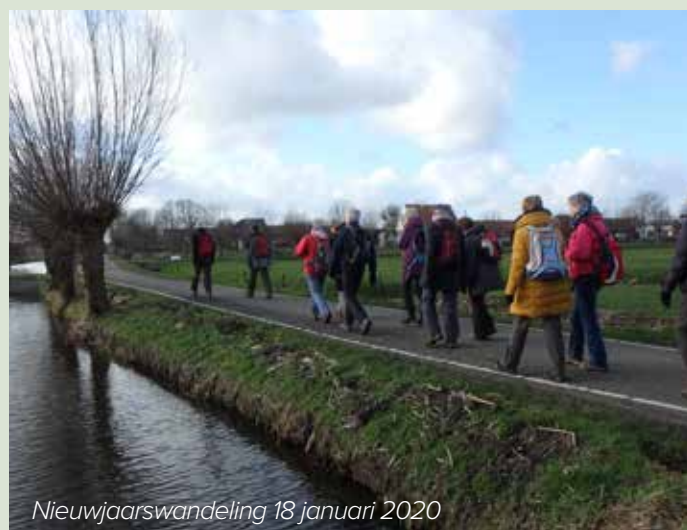
Nieuwjaarswandeling 18 januari 2020

Op zaterdag 16 januari organiseert de regio Zuid-Holland de traditionele Nieuwjaarswandeling. Zet het vast in je agenda. Plaats, tijd van vertrek en verdere informatie vind je rond de jaarwisseling op de website. Onder voorbehoud van de dan geldende coronamaatregelen. Organisator is Kees Rotteveel.