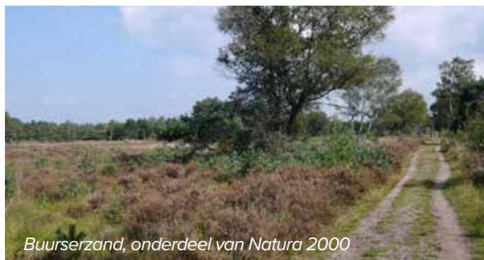
Buurserzand, onderdeel van Natura 2000

Het Buurserzand ten oosten van Haaksbergen is een natuurgebied van ca 750 ha, in beheer bij Natuurmonumenten. Het is een bijzonder nat gebied, waarin open heidevlakten, graslanden en bosjes elkaar afwisselen.