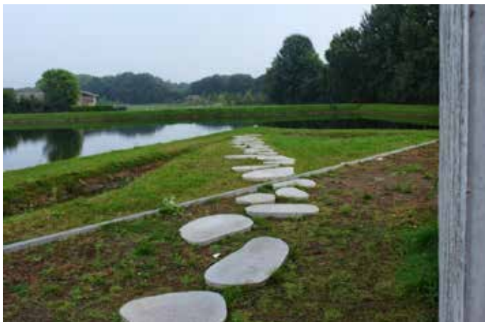
Stepstones Tilburg Moerenburg

'Ja, maar dat is behoorlijk aan het kantelen. Wij proberen in de gemeentelijke omgevingsvisies het wandelen op het programma te krijgen, maar dan merk je wel dat in sommige gemeentes wandelen nog steeds een grote onbekende is. Maar projectleiders zijn nu graag bereid ons te ontvangen en wij voorzien hen van de nodige algemene info en concrete knelpunten. We proberen voor iedere gemeente op de kaarten van de omgevingsvisie de LAWs, de streekpaden en het knooppuntenstelsel te laten opnemen, zodat die routes een formele status krijgen waardoor ze niet zo maar bij een uitbreiding of de aanleg van een nieuwe weg over het hoofd gezien kunnen worden.'