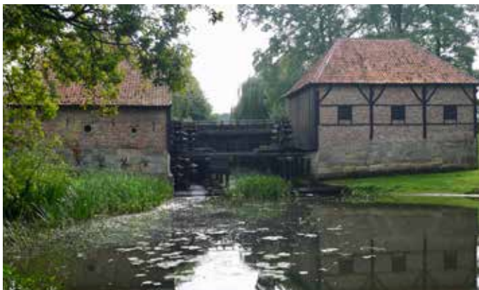
De oudste dubbele waterradmolen van Nederland

De wandeling begint bij de Oostendorper Watermolen in de Buurserbeek, ten zuiden van Haaksbergen.