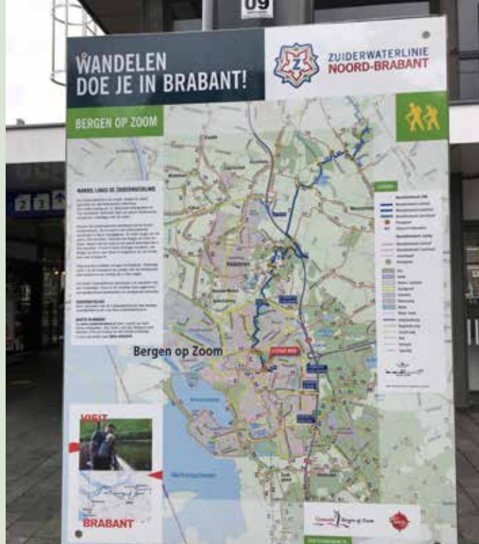
Bergen op Zoom, Stationsplein

Dat zo'n, nu overbodige, linie door het open land ook een mooie wandelroute kan vormen, is duidelijk. In 2000 verscheen de eerste uitgave van het Waterliniepad. Ook de verdedigingsring met 42 forten die De Stelling van Amsterdam vormt, is opgenomen in het wandelnetwerk. Sinds 2019 vormen die twee paden samen het (vernieuwde) Waterliniepad LAW 17, een 315 km lange route van Volendam tot Dordrecht. In Brabant kwam men op dezelfde gedachte en sinds twee jaar is er het wandelpad Zuiderwaterlinie, 290 km van Bergen op Zoom, via Willemstad en Den Bosch naar Grave, of andersom.