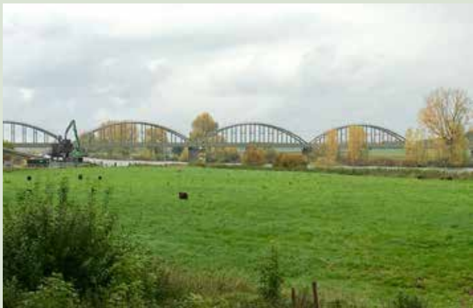
Maasdijk bij Ravenstein

Om authenticiteit te behouden doen oude vestingsteden als Heusden en Ravenstein niet aan asfalt. De bestrating bestaat uit kasseien en dat loopt niet lekker. Een wandeling door de kasteeltuin biedt dan een prettige afleiding. De route vervolgt, na het bolwerk met kanon, over de Maasdijk via een graspad met breed uitzicht op de rivier en de bruggen van het spoor.