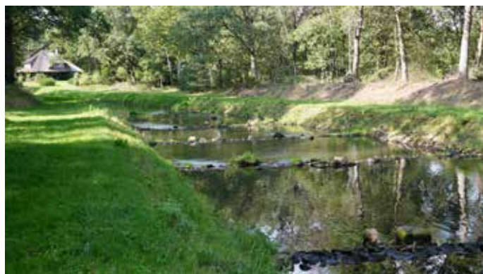
Jaagpaden aan beide kanten van de Buurserbeek

verwoest, niet alleen door oorlogshandelingen (in 1584), maar ook door onderspoeling en extreme watervloeden (in 1946). De molen is in 1987 grondig gerestaureerd en sindsdien weer in gebruik, zij het als museummolen, gerund door vrijwilligers. De Buurserbeek ontspringt net over de grens in Duitsland, stroomt vanaf de grens een stuk door zuid-Twente en Gelderland en dan weer door Overijssel (en heet daar Schipbeek) om bij Deventer uit te monden in de IJssel. De beek is al in de middeleeuwen gekanaliseerd om een vaarverbinding tussen de hanzestad Deventer en het Duitse Westfalen te maken voor het vervoer van onder meer hout en leem uit Duitsland en boter en kaas daar naartoe. Dat het een transportverbinding was, zie je nog aan de jaagpaden, bedoeld voor de trekpaarden van de schepen.