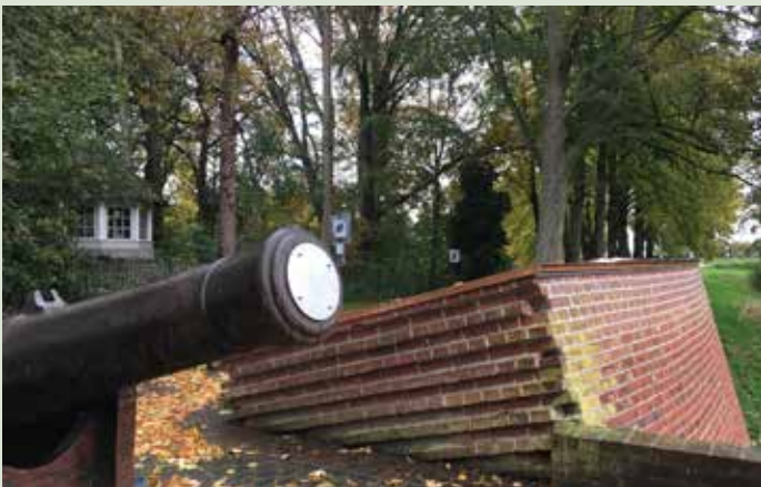
Het kanon is onklaar gemaakt

Een waterlinie is een militair verdedigingssysteem, ontstaan rond 1600. Om te voorkomen dat de vijand de stad kan bereiken, wordt het omringend land onder water gezet (inundatie). Niet te veel, dan kunnen boten worden ingezet, niet te weinig, dan loopt het vijandige leger er doorheen. Vanuit een aaneenschakeling van vestingwerken als forten en schansen wordt zo het land beschermd.