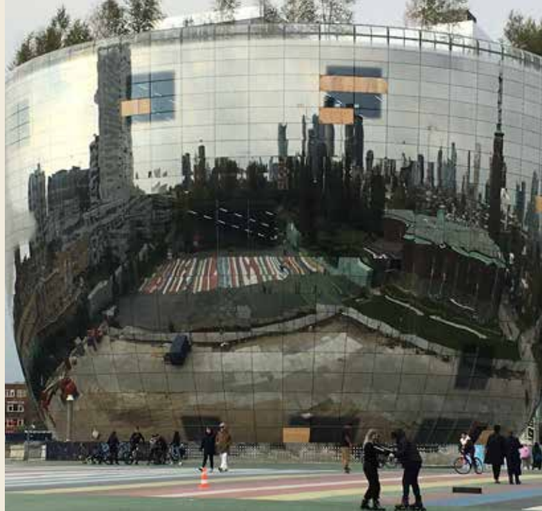
De pot met waardevolle inhoud

Via het Park kom je bij het Museumpark en loop je af op een rond, spiegeland gebouw. Een bijnaam kon niet uitblijven: de bloempot. Dit is het splinternieuwe depot van museum Boijmans dat in 2021 voor publiek geopend zal zijn, omdat het museum zelf nog jaren gesloten blijft i.v.m. restauratie. Zo'n openstelling is vrij uniek.