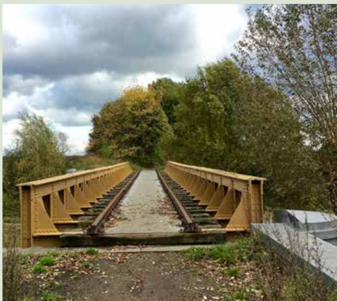
Van spoorbrug tot wandelpad

Een waterlinie omtoveren tot wandelpad is ze goed gelukt in Brabant. Maar al eerder deden ze dat met een spoorlijn. Tussen Vlijmen en Den Bosch liep vanaf 1890 de Halve-zolen-lijn. De naam duidt op enkel (half) spoor, terwijl dubbel was voorzien. Anderzijds heeft het ook te maken met het transport van schoenen. In 1972 is de lijn gesloten, vervallen, maar met Europese subsidie grondig opgeknapt en in 2011 als wandelpad geopend. De 33 m lange Verkantbrug brengt je over een oude inundatiezone. Daarna loop je over een dijk tot de spoorbrug over de Moerputten, het grootste laagveengebied in Noord-Brabant. De 600 m lange brug hoort niet bij de waterlinie, maar is een omweg waard.