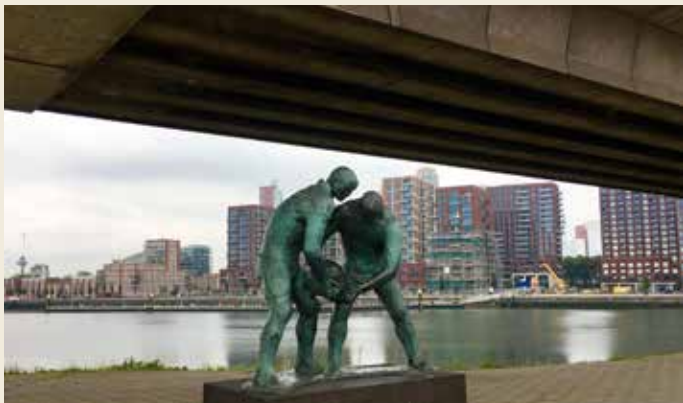
Het nieuwe Katendrecht

Halverwege de Maashaven, onder het spoor van de metrolijn, staat het beeld Dijkwerkers (1970) van Ek van Zanten. Met een basaltblok gaan twee stoere mannen het opkomende water te lijf.