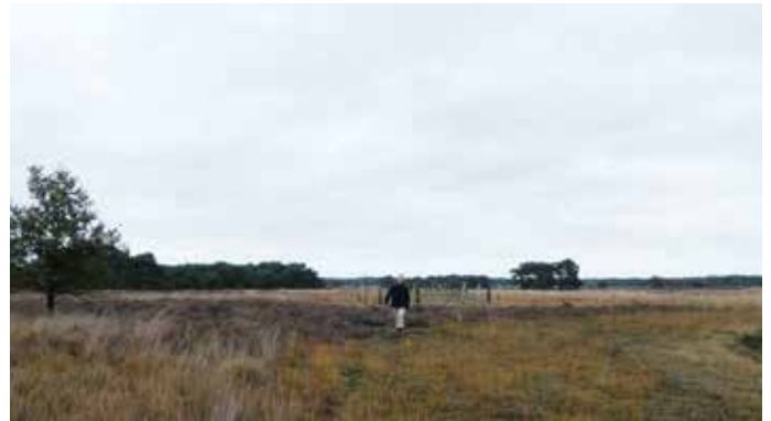
Rechte Heide bij Goirle

want daar willen we rustgebied. En dan merk ik dat men wel wil meewerken om een alternatief aan te reiken. Ook met sommige waterschappen werken we heel goed samen. Bij het openstellen van schouwpaden voor de wandelaar is het: ja, mits. Overigens is het bij weer een ander waterschap precies omgekeerd. We bespreken dan: een kant met wandelmogelijkheden en aan de andere kant natuur. Soms moet het waterschap wel zeggen: "Hier zitten we echt in een ecologische verbingszone, hier kan wandelen niet."