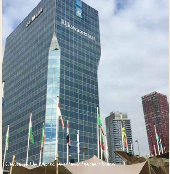
Gebouw De Maas, een bescheiden kolos

Vanaf het dakterras heb je een spectaculair uitzicht op de diversiteit aan torenhoge gebouwen aan de andere kant van de Maas. Maar ook aan deze kant van de rivier wil men de lucht in. Er zijn plannen voor woontorens van 100, 150 en zelfs 250 m hoogte. Ter vergelijking: de Euromast is 185 m hoog.