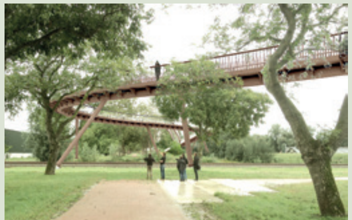
Geplande brug Lingezege (afbeelding: korth tielens architecten)

In het nieuwe landschapspark Lingezege (zie ook pagina's 5-6) is wel aandacht voor wandelaars. Vanaf begin 2020 kunnen zij via een brug over het spoor bij De Park naar Het Waterrijk lopen. Geen omweg meer via Elst, maar met deze nieuwe wandel- en fietsbrug het spoor tussen Arnhem en Nijmegen oversteken. En er komt ook een veilige oversteekplaats over de Rijksweg-Noord.