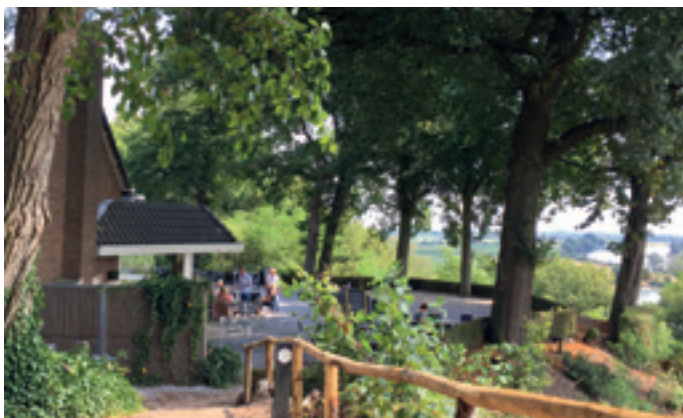
Westerbouwing met uitzicht over de Rijn

Direct een goed begin: door zijn hoge ligging biedt het een fantastisch uitzicht over de Rijn en de Betuwe met aan de horizon Arnhem, Elst en Nijmegen. Het landgoed ontwikkelde zich in de 19de eeuw van boerenbedrijf tot aangename verblijfplaats voor de Arnhemse eigenaren. Daarna kwam het in bezit van de gemeente Renkum en werd het een geliefde uitspanning voor dagjesmensen uit de (verre) omgeving. Tijdens de Slag om Arnhem werd het grotendeels verwoest. Na de oorlog wordt de schade hersteld en wordt het opnieuw een populaire trekpleister met diverse attracties zoals een stoeltjeslift en een speeltuin. Veel ouderen zullen zich de schoolreisjes naar dit spannende gebied nog herinneren! Helaas was de Westerbouwing niet bestand tegen de concurrentie van de nieuwere attractieparken en werd het park in 1990 ontmanteld; het restaurant fungeert nu als evenementencentrum (op zondag is het café geopend). Het landgoed is volledig toegankelijk voor het publiek en het uitzicht blijft fascinerend!