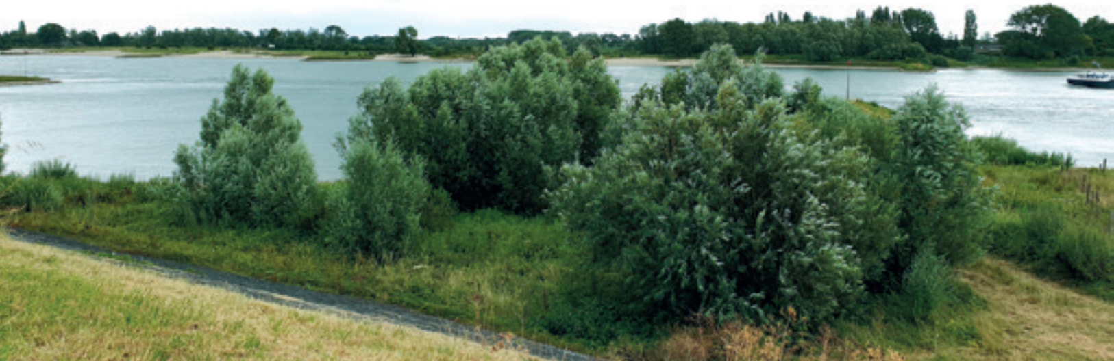
de Waal bij Nijmegen

hij zich bewust is van de natuurwaarden van een gebied: herten schrikken op, je vertrapt planten. Anderzijds, soms mag je ergens überhaupt niet lopen en dan vraagt hij zich wel eens af: “Wat vernielt de wandelaar in dat gebied?”