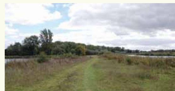
Tussen de Linge en een zandwinningsplas een natuurgebied door

Ongeveer honderd meter na de toegangsweg richting Asperen ga je links naar beneden, hek door en wandel je parallel onderaan de dijk totdat je ingang ziet door hek. Je volgt nu de route van