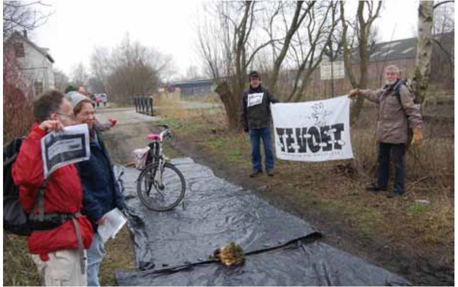
(bijna) 20 jaar in actie voor onverhard wandelen in Nederland