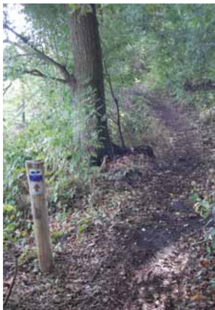
Bospad langs het Voordaanse pad

zijn aan de linkerzijde nog restanten te zien van een in onbruik geraakte eendekooi. We volgen het pad door het naaldbos verder naar links en genieten van het coulissen landschap. Volg de markering tot bij een sluis of stuw die bij NHW hoorde en nu zijn nut al weer vele jaren bewijst in een modern waterbeheersplan. Volg de Beukenburgerlaan naar links tot aan de Groenekanseweg. Het landgoed Beukenburg ontleende zijn naam aan de talrijke statige beuken, maar het landgoed werd verlaten en veranderde in een instelling, daarna in een Asielzoekers Centrum en nu het zijn nut heeft verloren is het gesloopt. Aan het einde van de Beukenburgerlaan gaat de route linksaf de Groenekanseweg op. U kunt de route op dit punt verkorten tot 8 km door rechtsaf de