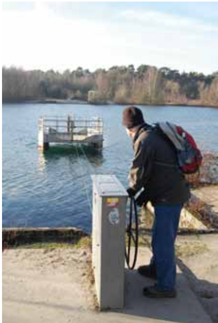
Het zelfbedieningspontje overbruggt een grote plas

van de Maas. De routemakers vonden waarschijnlijk ook zelf dat de route over asfalt met ander verkeer niet prettig was. Daarna zijn we tot net voor Wellerloo gelopen en hierna naar de N271 gelopen, waar de bushalte Kruisstraat is. Eventueel kan je wat verder Wellerloo inlopen en een bushalte verder nemen.