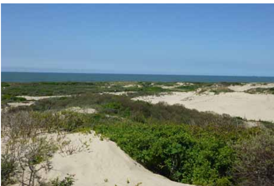
Van de toppen een prachtig uitzicht op het landschap en de zee

Aan het eind van de etappe wacht nog een verrassing: de nieuwe boulevard van Scheveningen, op 6 april jl. feestelijk geopend door minister Schultz van Haegen van Infrastructuur en Milieu. Ook hier is de route enigszins aangepast.