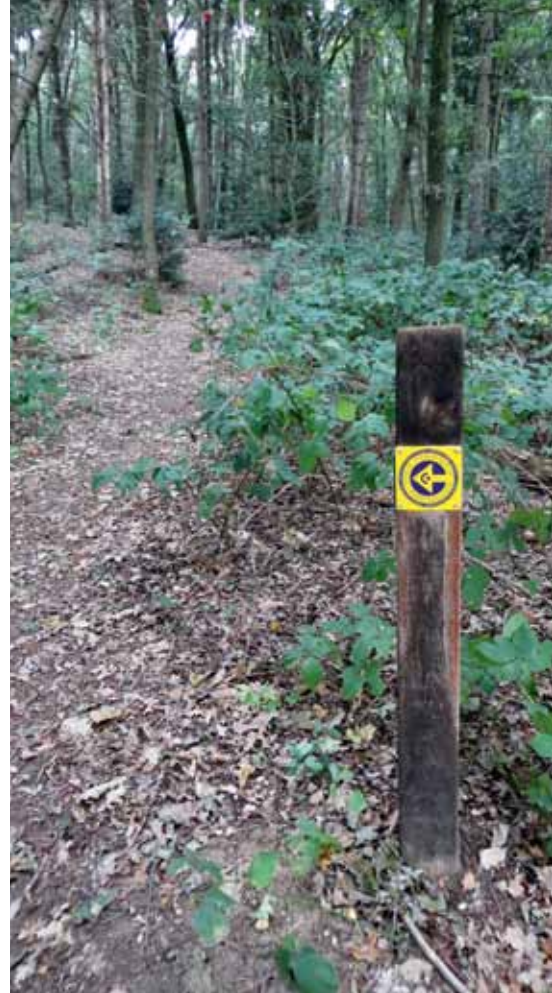
De markering wijst het bos in