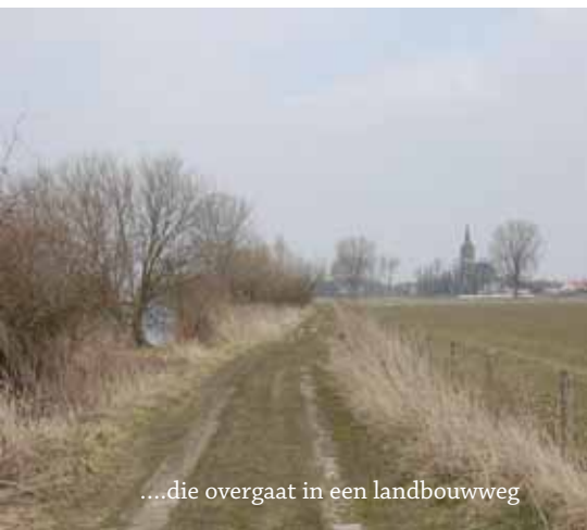
....die overgaat in een landbouwweg

Ter hoogte van Appeltern, dat aan de overkant ligt, moet je twee keer op ongeveer 10 meter van elkaar onder een prikkeldraad hek door. Aan je rechterkant is grond afgegraven. Beide gebieden zijn opengesteld door Natuurmonumenten, maar er ontbreken klaphekjes. Je blijft de Maas volgen. De klaphekjes vind je wel verderop, hier staat ook een wandelknooppunt paaltje met nummer 80 (dan ben je weer op de route van Anders langs de Maas). Ga verder richting knooppunt 12. Aan je rechterhand