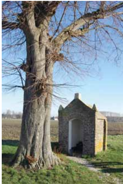
Een kapelletje bij de Maas

Afgezien van de doortocht door verschillende plaatsjes is de gelopen route bijna geheel onverhard of misschien beter gezegd half verhard met platgereden grind en zand. Er zijn enkele punten, waar je door rul zand moet 'ploeteren'. Mijn ervaringen tot nu toe met wandelen in Nederland zijn dat als je onverhard wilt