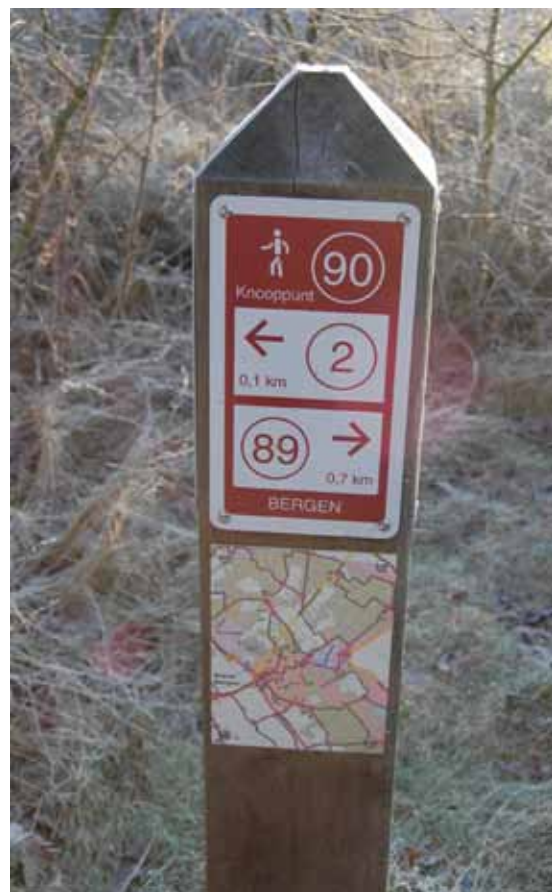
Handig een kaartje op het knooppuntenbordje

Na het meer loop je naar Well, een mooi plaatsje aan de Maas met diverse horecagelegenheden. Daarvoor eerst langs kasteel Well (niet toegankelijk).