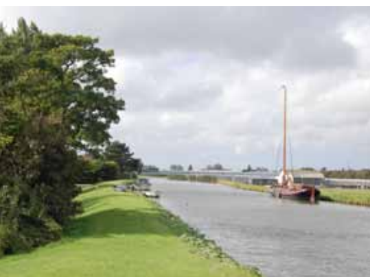
Het beurtschip ligt aan de overkant

De routegids is te koop bij het gemeentehuis, Parelhof 1 en Kompas Outdoor, Nobelstraat 14, beide in Heerhugowaard, voor 5 euro per stuk. De speciale routeapp die beschikbaar is voor zowel iPhone als Android, kan gratis worden gedownload in Appstore en Playstore.