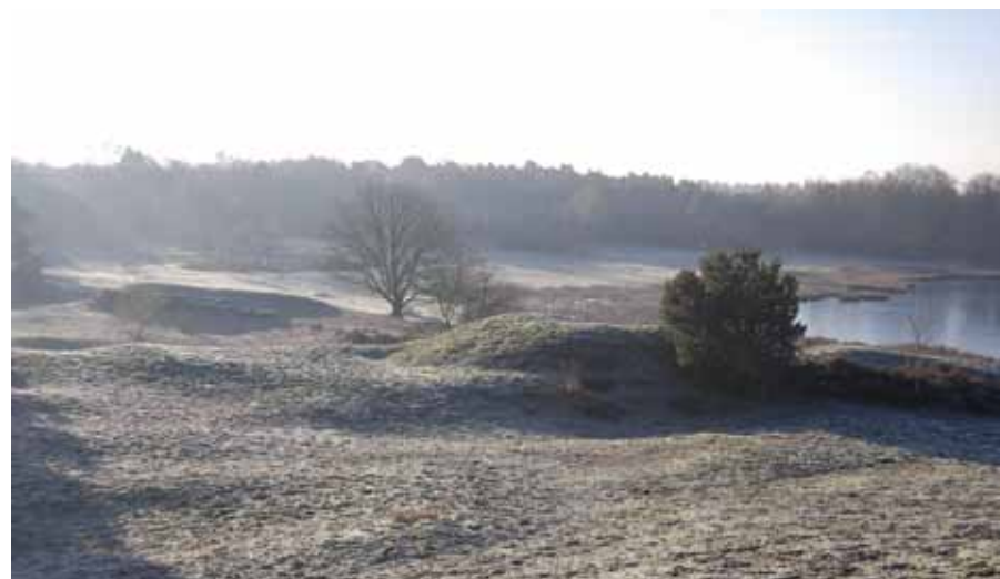
Zicht vanuit een duin op het landschap

Bij Well loop je even langs de Maas. Helaas is dit deel langs de Maas geheel verhard, hoewel er wel een grasstrook is. We zelf liepen na onder de brug van de N270 doorgeslagen te zijn, toch even een weiland in door een klaphekje en daarna bij de oever van de Maas naar links. Aan het eind van het weiland, was er een overstapje om weer op de weg te komen. Mogelijk is het klaphekje en overstapje gemaakt voor vissers, die aan de Maas gaan vissen, maar voor ons was dit een mooie extra. Ten opzichte van een eerdere versie van de route, ga je nu al ook sneller weer weg