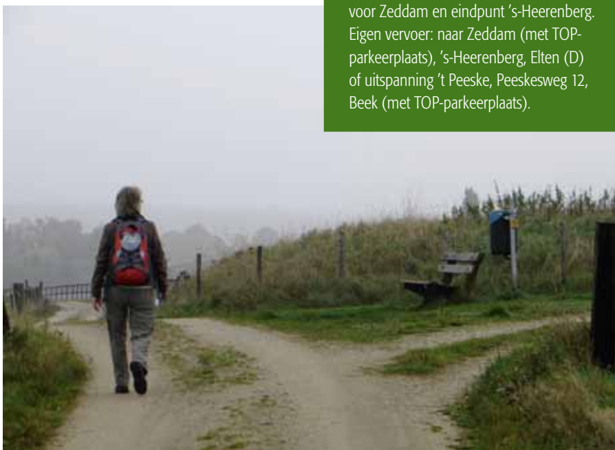
Op de Molenberg

Nog voor uitspanning 't Peeske, een voormalige watermolen, horen we het geluid van gezaag. Een reusachtige machine legt binnen vijf minuten een boom om en zaagt de stam ook nog eens in gelijke delen. In een 18-jarenplan wil Natuurmonumenten het volgens hen eentonige bos gevarieerder maken. De van nature voorkomende bronnen, bronbosjes en beeklopen worden hersteld of beschermd. Rechte paden moeten slingers worden. Wie nu denkt dat dit een saaie wandeling is, vergist zich. Er zit al veel gemengd bos in deze wandeling, op open plekken schieten jonge bomen en struiken op en het vingerhoedskruid grijpt na vele jaren als zaad in de bodem te hebben gewacht, zijn kans nu er weer licht komt. Bij een plasje water verwacht je ieder moment een wild zwijn uit de hoge