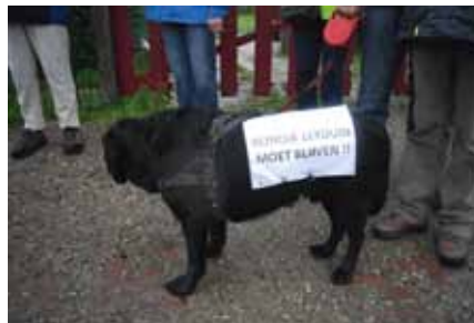
Ook Bello wil de overgang blijven gebruiken