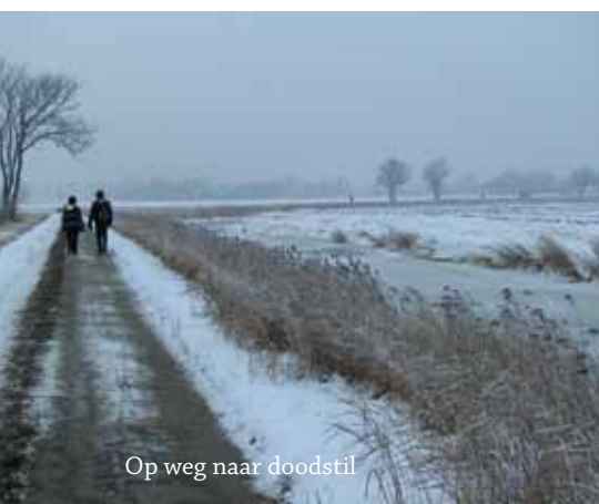
Op weg naar doodstil

Het was net die ene week dat het echter winter was in Nederland: donderdag 24 tot en met zondag 27 januari 2013. Het was koud, donker en er lag sneeuw in overvloed en zo'n 500 wandelaars maakten zich op voor De Noorder Rondtochten. De winter4daagse volgt in vier etappes de route van de Groninger schaatsklassieker De Noorder Rondritten, niet gek dus dat de wandelaars geheel in winter- en schaats sfeer waren.