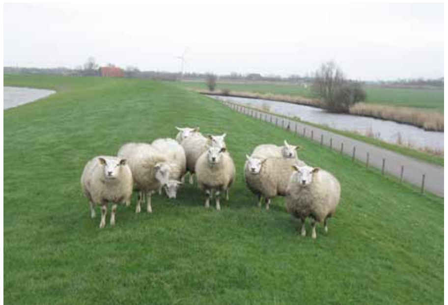
Mede wandelaars op de dijk?

Ter gelegenheid van het 10 jarig bestaan van dit gebeuren had ik bedacht dat het leuk zou zijn om op een historische plek een herinnering te plaatsen en wel in een vorm waar de langskomende wandelaar iets aan heeft. Dat is een picknicktafel geworden, waarvan er langs veel LAW's helaas te weinig voorkomen