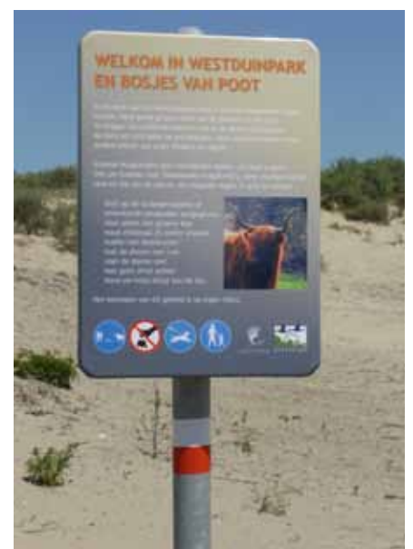
Een Natura 2000 gebied