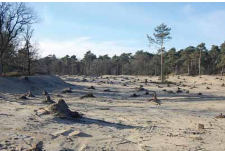
Het zand mag weer stuiven, bomen zijn verwijderd

elk halfuur, zondag een maal per uur. Je kunt hierdoor gemakkelijk je begin- of eindpunt bereiken of na een wandeling naar je auto op het beginpunt terugreizen.