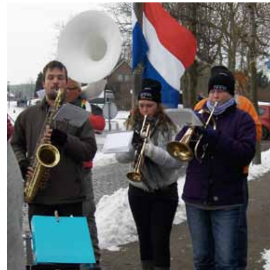
Ontvangst in Warffum

We liepen de eerste dag in echte winterse omstandigheden (er werd bij de start -7 gemeten!) van Groningen via het Schildmeer (met schaatser!) naar Appingedam (ruim 28 km). Alle wandelaars kregen een heerlijke kop