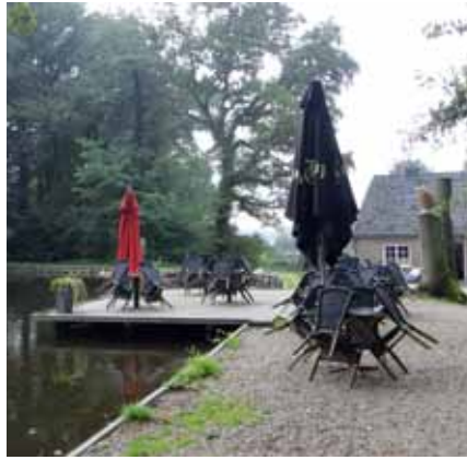
't Peeske: een mooie locatie

geelverkleurde adelaarsvarens te zien komen, ware het niet dat immigranten uit Duitsland hier niet welkom zijn. Dat we hier boven op de stuwwal zijn, is ook te zien aan de soms grote kiezelstenen. Voorbij 't Peeske lopen we op de rand van bos en boerenland dat zowel hier als elders uit graanakkers bestaat, ook beheerd door Natuurmonumenten. Op deze akkers worden geen bestrijdingsmiddelen of kunstmest gebruikt. Er worden granen als rogge, haver en gerst volgens EKO-richtlijnen geteeld. Tussen het graan is nog plaats voor akkerkruiden. Een deel van de akker mag 's winters blijven staan voor vogels, dassen, muizen, reeën en roofvogels. Dan komen we op een deel van het Pieterpad, een wat langer maar toch aangenaam recht stuk. Dat wordt anders als we om wille van de tijd besluiten gebruik te maken van de verbindingsroutes aangegeven door de knooppuntpaaltjes. Eerst gaat het nog. Afdalend het bos uit kan het niet anders gelet op het uiterlijk van de windmolens dat Duitsland dichtbij is en zien we daar rechts niet de contouren van de Rijnbrug bij Emmerich? Maar dan komt het: bijna 2,5 km over de Oude Eltenseweg, eerst een lang recht stuk half verhard langs een betonfietspad tussen akkers, gevolgd door een eindeloos lijkend brede boslaan. Met een "ork, ork" neemt een raaf afscheid, maar we moeten deels over een