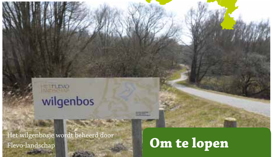
Het wilgenbosje wordt beheerd door Flevo-landschap

Vorig jaar is NS begonnen met de introductie van stadswandelingen. Ging het toen om Amsterdam en Rotterdam, dit jaar is Den Haag aan de beurt. Voor liefhebbers van natuurwandelingen minder interessant. Hoewel ... Den Haag is een groene stad en de route doorkruist dan ook, naast het Haagse Bos, verschillende parken zoals Clingendael, het Westbroekpark en de Scheveningse bosjes. En niets weerhoudt je om in Scheveningen een stukje strand mee te pakken! Het tweede dat opvalt is dat in vergelijking met vorige jaren minder gebruik wordt gemaakt van langeafstandspaden (LAW's). Loopt de route in Texel nog via het streekpad Wad-