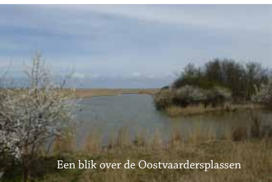
Een blik over de Oostvaardersplassen

Hoe beoordelen wij nu deze wandeling? Pluspunten zijn er zeker. Het is een unieke wandeling die met niets te vergelijken is. Een paradijs voor liefhebbers van water, wilde natuur en vooral van vogels (getuige ook de verschillende vogelkijkhutten die je tegenkomt). Aan de andere kant: alles is nieuw. Geen leuke paadjes of weggetjes, geen kleine dorpjes of terrasjes onderweg. Een nadeel vond ik het kleine percentage onverhard. Voor TeVoet'ers bijna een vereiste. Zij komen wat dat betreft niet aan hun trekken. Zelfs de Oostvaardersplassen bekijk je vanaf het naastgelegen, 2 km lange, betonnen fietspad. Ga kijken en oordeel zelf!