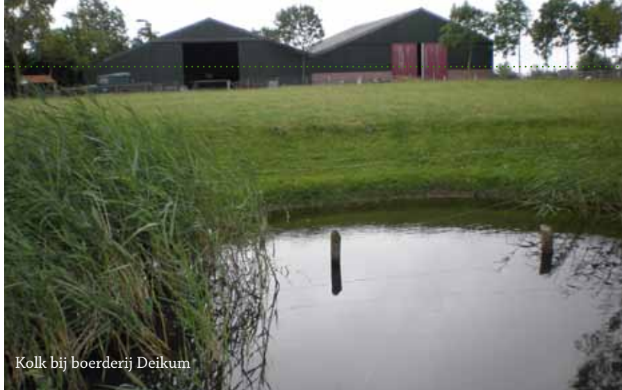
Kolk bij boerderij Deikum