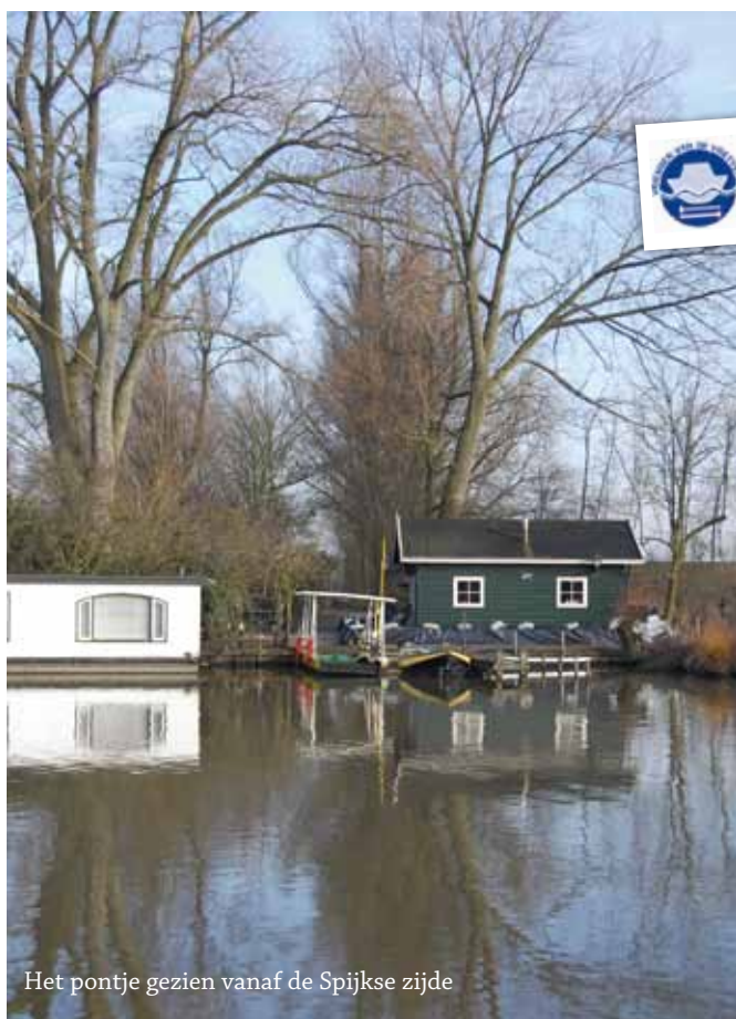
Het pontje gezien vanaf de Spijkse zijde

Om deze doelstellingen te realiseren is een jaarplan opgesteld. Bij de uitvoering daarvan werken we zoveel mogelijk samen met andere organisaties, die gemeenschappelijke belangen nastreven.