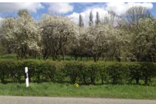
Boomgaard bij Spijk

Horeca is er ook in Tolkamer aan de Europakade, op enige afstand van de route.