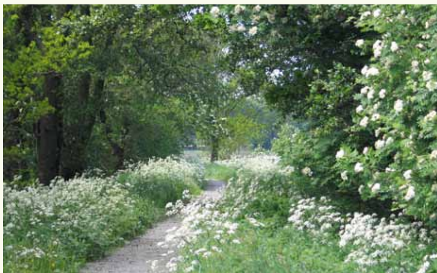
Ten zuiden van Meeden

NB: het 1e kaartje geeft ook een deel van de route weer van de route van Schipborg naar Veendam, die abusievelijk niet was opgenomen in het vorige nummer.