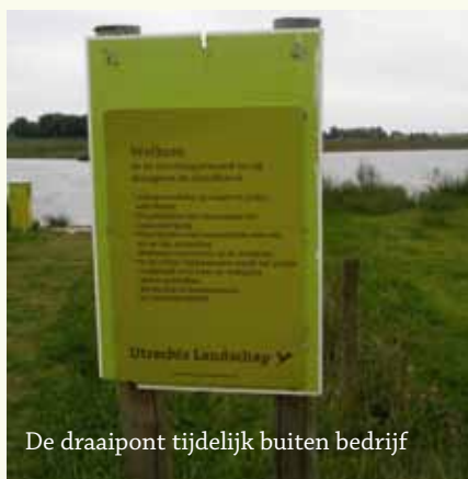
De draaipont tijdelijk buiten bedrijf