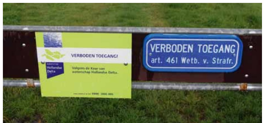
In de toekomst toegankelijk voor wandelaars?