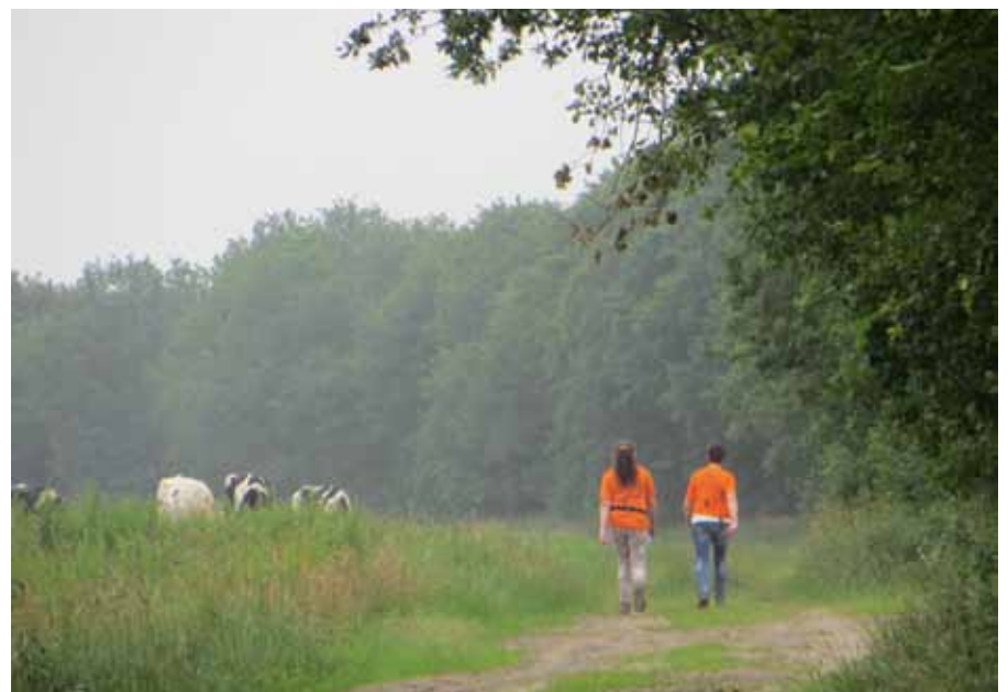
Tussen Deurze en Rolde