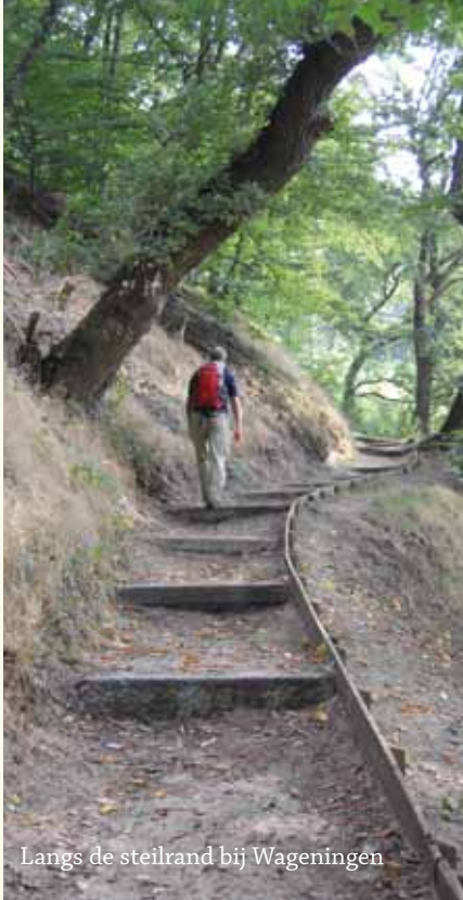
Langs de steilrand bij Wageningen

uitspanning rechtsaf over grasveld en bospad in.