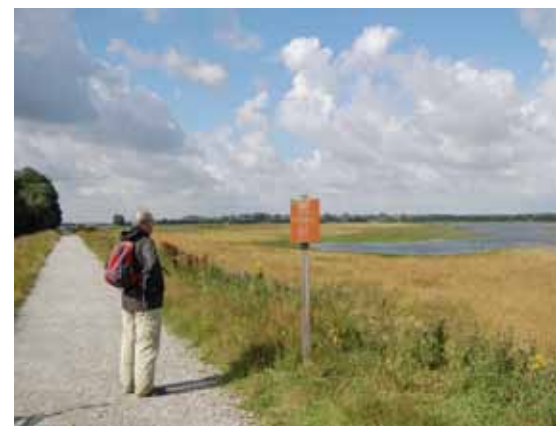
Nieuwe natuur te belopen voor wandelaars

Maar voordat we onze reactie de deur uit doen, horen we als bestuur graag van onze leden welke (aanvullende) ideeën er nog bij hen leven. Reacties kunnen tot 1 september worden gestuurd aan info@tevoet.nl .