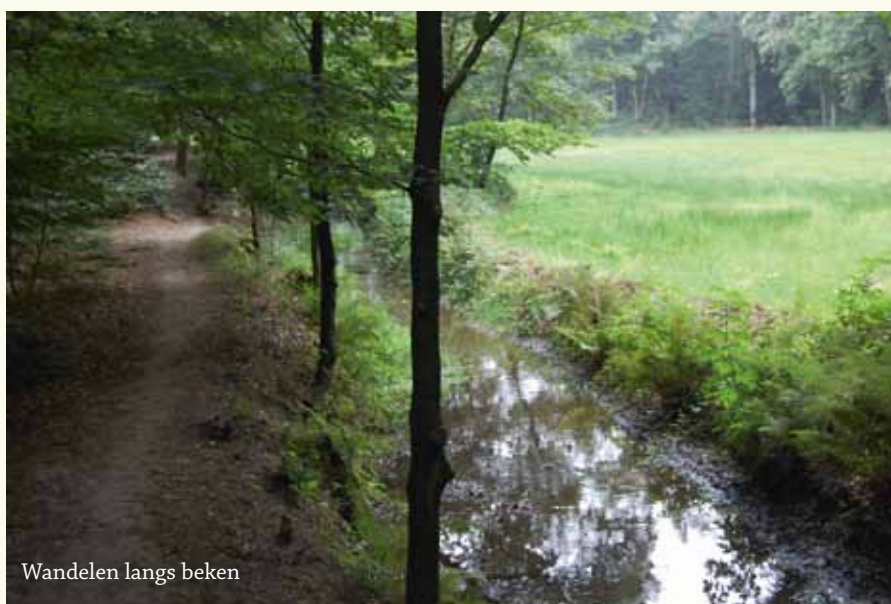
Wandelen langs beken